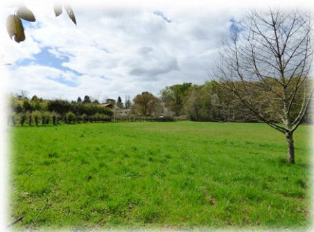
Secteur « petit maître » ajouté au périmètre du site Natura 2000 à Cénac

Le COPIIL a ainsi validé une extension de 21 ha sur le bois de Bernadotte à Latresne, sur des fonds de prairies à Carignan-de-Bordeaux, ainsi que sur des boisements de feuillus et prairies appartenant à la commune de Cénac le long du Rauzé. 29 ha sont encore en attente de décision , les communes consultant les propriétaires des parcelles concernées.