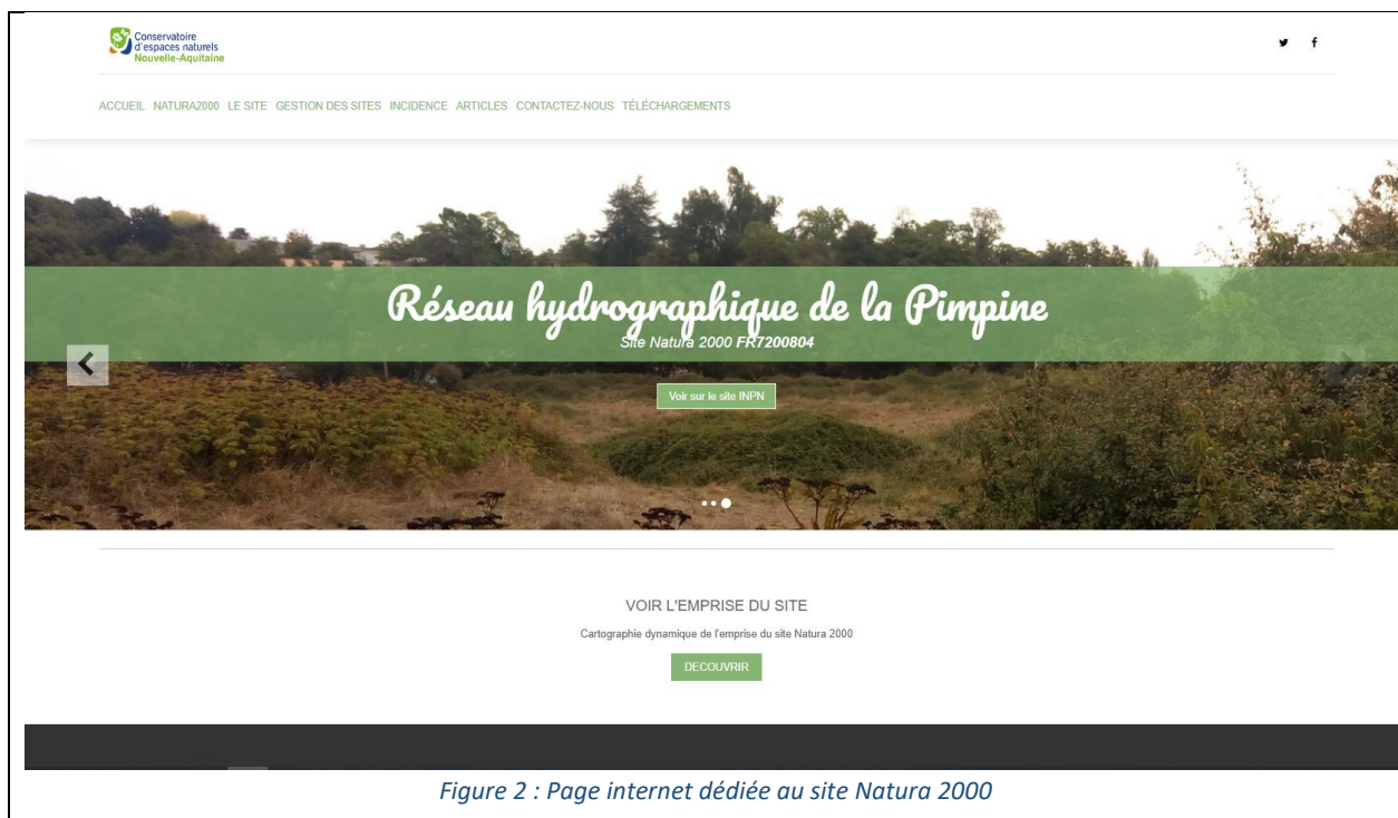
Figure 2 : Page internet dédiée au site Natura 2000

Il est important de noter que ce site est transférable en cas de changement d'animateur. Le site est opérationnel depuis début 2021 et peut être visité à l'adresse suivante : https://reseau-hydrographique-pimpine.fr/